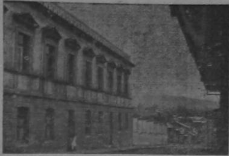
Costado Sur del magnifico edificio del Colegio de Señoritas